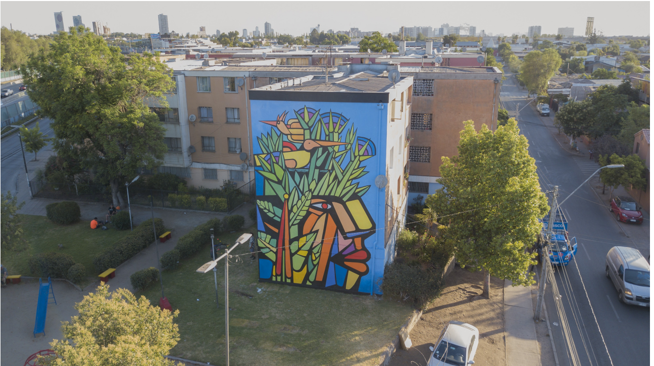
Renca (CL) 2019, © Benjamin Oyarzo